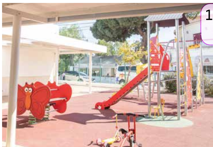
1 As crianças da EB Bairro Alentejano já desfrutam do logradouro renovado