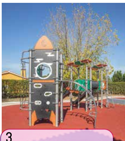
3 A reabilitação do Espaço de Jogo e Recreio de Quinta do Anjo está em conclusão