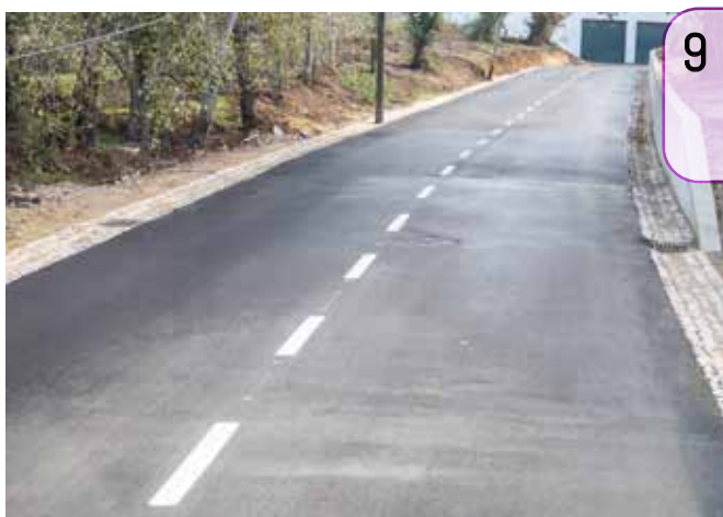
9 ... de pavimentação da Rua José Luís da Silva Camolas (Palmela)...