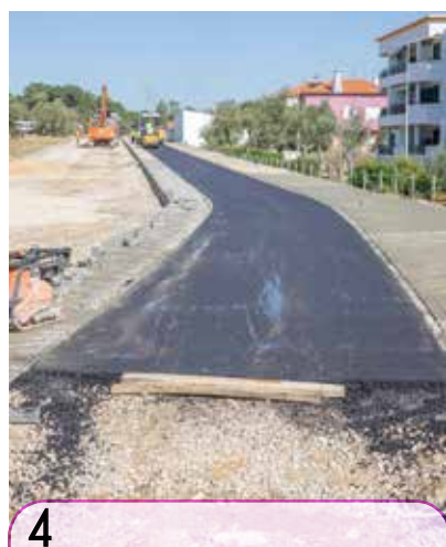
4 Em Aires, avança a abertura do novo arruamento, com ciclovia, entre a Av.ª Joaquim Lino dos Reis e a Rua de Aljubarrota