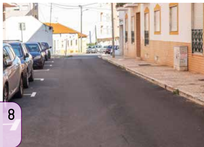
8 Concluídas as empreitadas de repavimentação de arruamentos em Pinhal Novo sul...