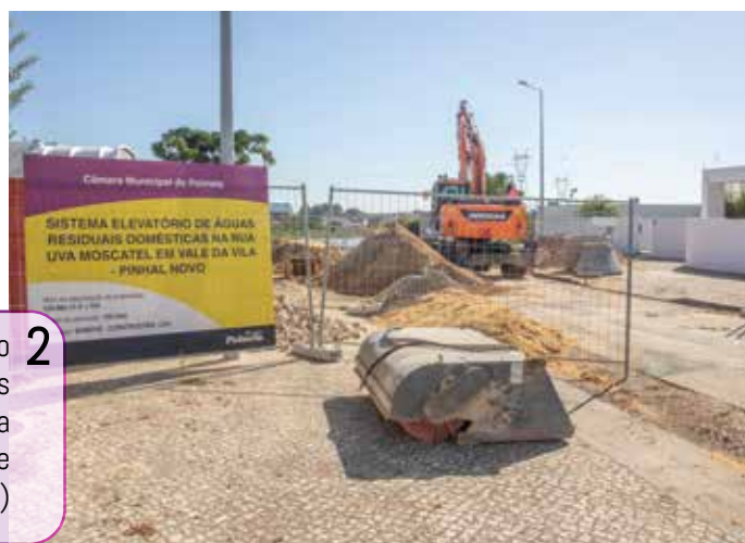
2 Teve início a construção do sistema elevatório de Águas Residuais Domésticas da Rua Uva Moscatel, em Vale da Vila (Pinhal Novo)