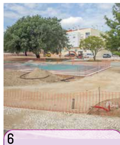
6 O Jardim Ferreira da Costa (Venda do Alcaide) está a ser beneficiado.