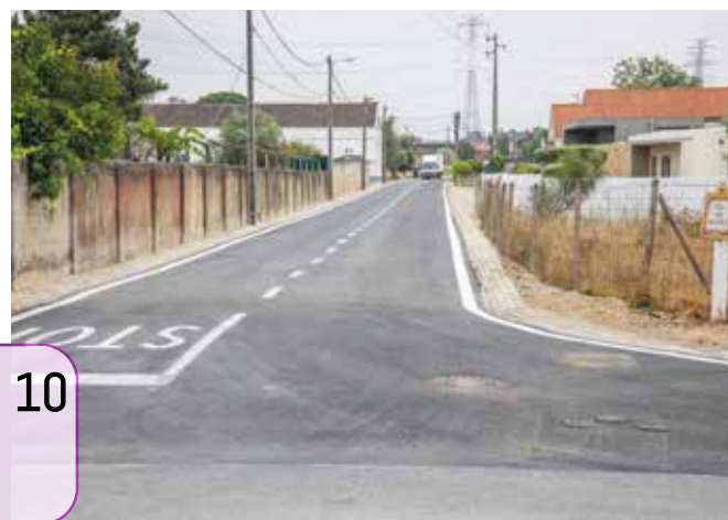
10 ... e de pavimentação da Rua de S. Francisco (Vale de Touros)