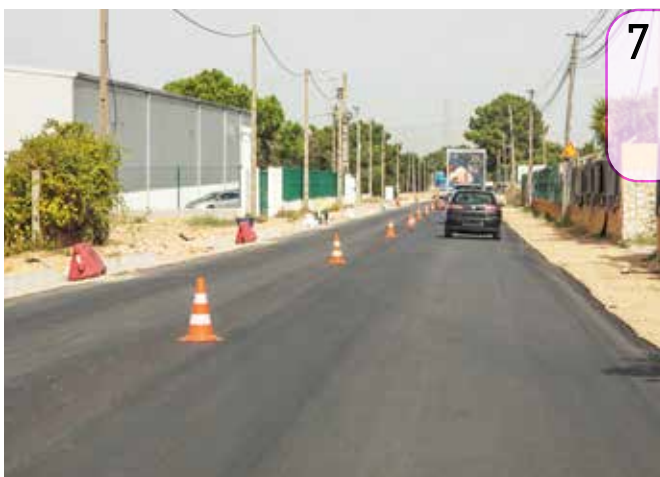
7 A reabilitação da Estrada dos Quatro Castelos - 2.ª fase da ação HUB-10 (Vila Amélia) está a decorrer